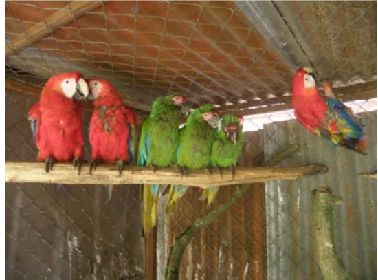
Guacamayas rojas y militares. Las Guacamayas militares ya se extinguieron en Guatemala, así que estos ejemplares obviamente fueron comprados en el tráfico internacional de animales silvestres. Scarlet and Military Macaws. Military macaws have already gone extinct in Guatemala, so these macaws were obviously purchased in the international trade.

Under Guatemalan law, physical evidence must be maintained until a trial has been completed, so we are not sure how long we will be keeping the animals in our Guatemala City office, though we are constantly soliciting the judge to allow us to at least transfer the animals to the Rescue Center in Peten.