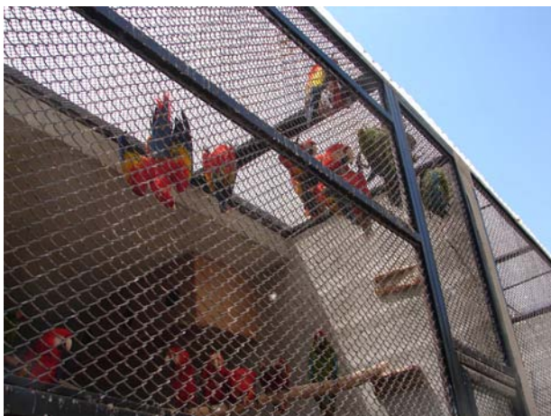
Los 17 guacamayas fueron encontrados en una solo jaula sin ningún ambiente natural, obviamente sufriendo de estrés. The 17 macaws were found in one cage with no natural enrichment and obviously suffering from stress.

The owner of the house was arrested at the scene, but claimed innocence, saying that he had just purchased the home and inherited the animals with it. The infrastructure was significant, and there were indications that further construction was planned. Many of the species were not native to Guatemala (Capuchin monkeys...) suggesting that the animals had been purchased on the international market.