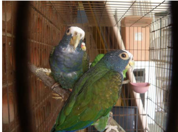
White-fronted parrots/Loro Frente Blanca

12 Marzo, 2010, Ciudad Guatemala El día de hoy, se recibió una llamada del Consejo Nacional de Áreas Protegidas (CONAP), solicitando apoyo para realizar un decomiso de animales silvestres en una casa particular ubicada en la zona 2 de la ciudad capital. Se tramitó una orden de allanamiento respondiendo a una denuncia recibida por parte de una persona que trabaja en un edificio a la par de la casa, quien desde su ventana divisó a los animales en el jardín de la casa. En dicha vivienda se decomisaron un total de 81 animales, de 21 especies, incluyendo loros, guacamayas, tucanes, monos capuchinos y arañas, venados, mapaches y caimanes. Dado a la gran cantidad de animales, el CONAP solicitó el apoyo del Zoológico Nacional La Aurora y ARCAS para poder identificar y dar albergue a estos animales mientras se realiza el proceso legal. Por consiguiente quedaron a cargo y custodia en ARCAS los animales abajo mencionados